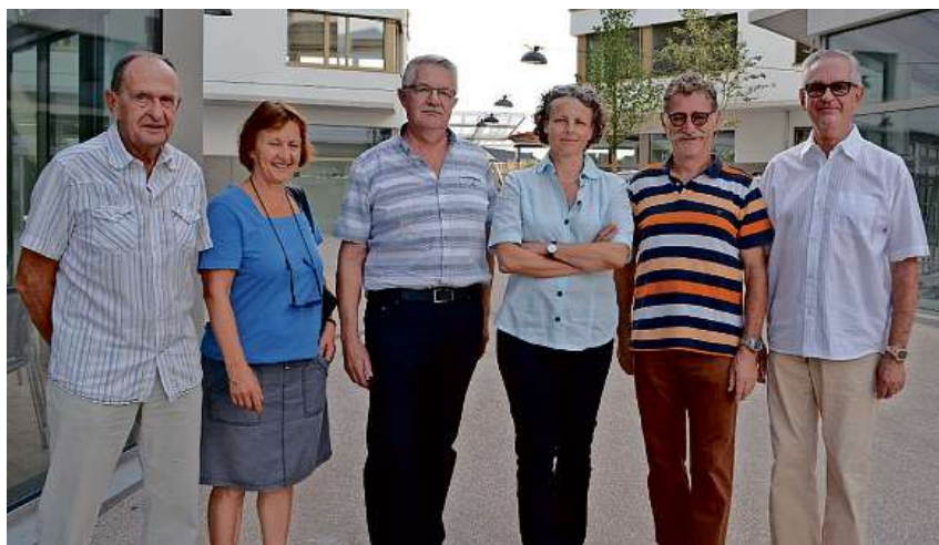
Aufstand gegen das Verdichten. Die Widerstandsgruppen vereinen sich.

Das war der Anfang: 53 Prozent der Stimmbürger sagten Nein zum Ausbau der St. Gallerstrasse und damit zum geplanten Neubau Jona Center. Dasselbe erreichen wollen die Gegner des «extremen Verdichtens» bei der Rütistrasse, am Meienberg und im Eichfeld. Neu vereinen sich die Widerstandsgruppen gar noch und treten gemeinsam gegen die Teilrevision des Baugesetzes der Stadt an. Seite 7