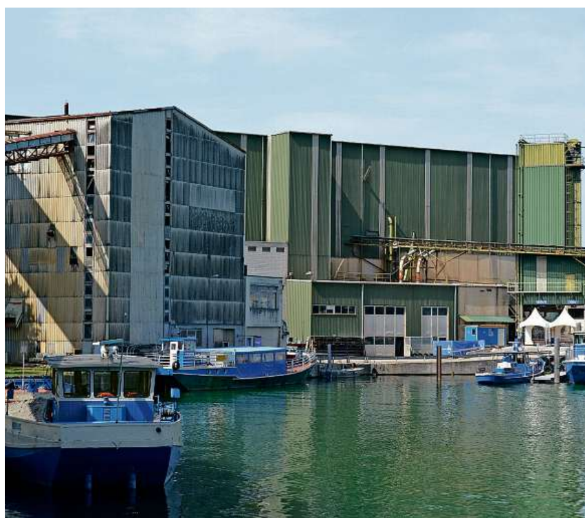
Dieses Betonwerk dürfte schon zweieinhalb Jahre nicht mehr hier stehen.

2008 unterzeichneten die Kibag mit den Gemeinden Wangen und Tuggen einen Vertrag. Die Kibag erhielt darin das Recht, in den örtlichen Gruben weiterhin Kies abzubauen und wieder aufzufüllen. Das Ganze wurde noch verquickt mit dem Kibag-Projekt, an das Obersee-Ufer 65 Häuser zu bauen. Im Gegenzug verpflichtete sich der Baumulti, sein Betonwerk in Nuolen bis Ende 2014 abzubauen und die Kiesförderbänder bis Ende 2016 unter Boden zu legen. Beide klar fixierten Verpflichtungen hält die Kibag nicht ein. Die Gemeinden lassen das nicht nur zu, sondern bewilligten ihr kürzlich sogar explizit, die Anlagen weiterhin stehen zu lassen. Seite 5